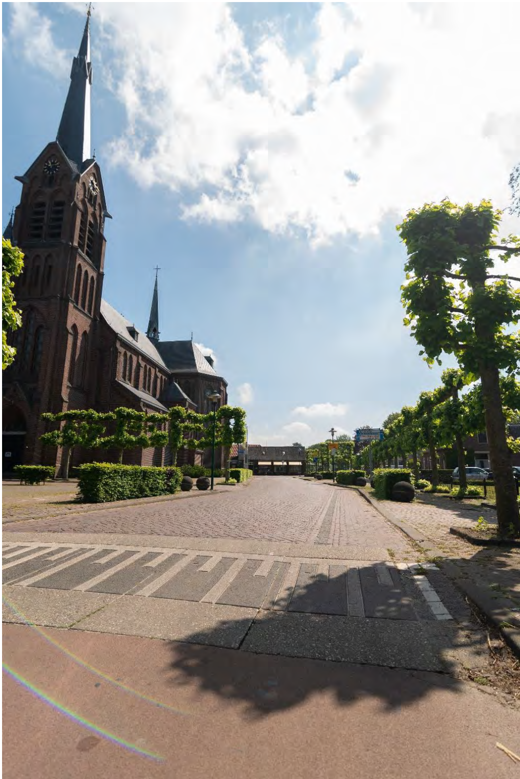
Centrum De Moer