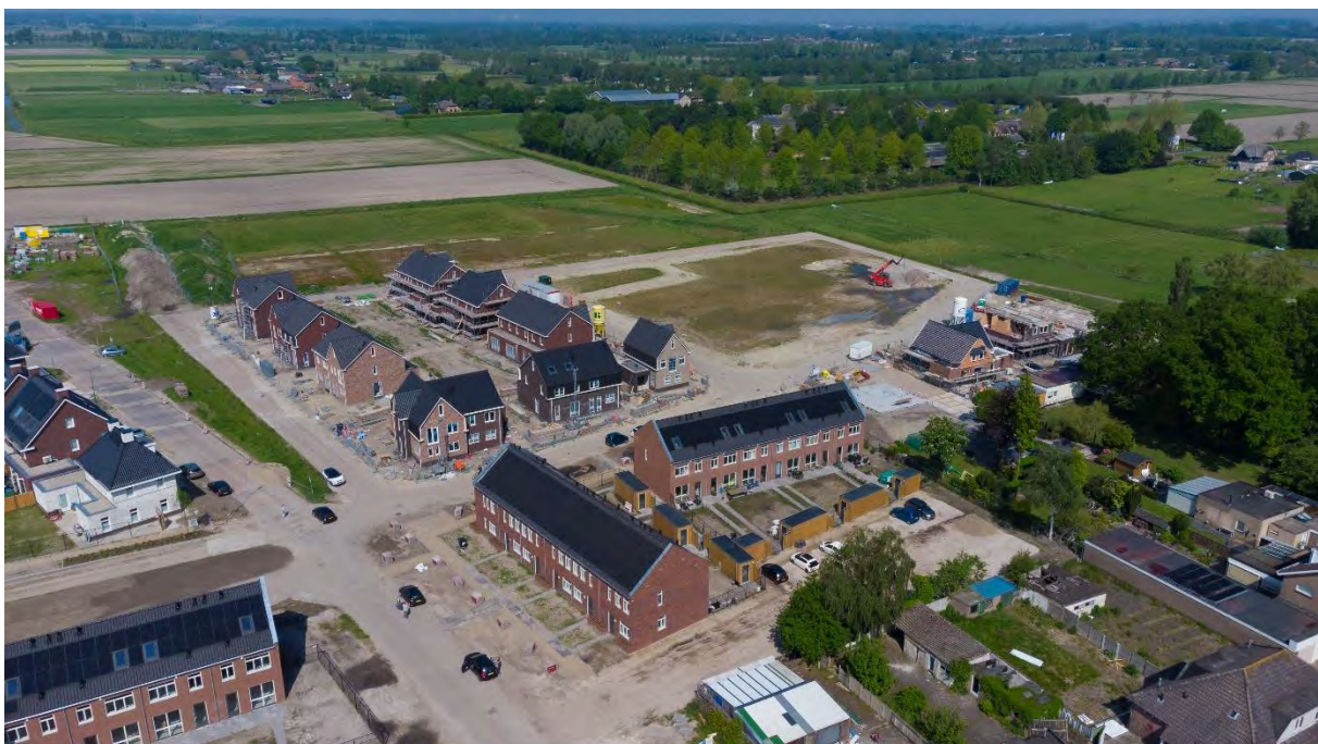
Westwaard in aanbouw, Kaatsheuvel

Pro3 stimuleert het kopen en/of verbeteren van woningen door startersleningen en leningen om de woning toekomstbestendig en duurzaam te maken. Duurzaam en vernieuwend bouwen met hergebruik van materialen vinden we belangrijk.