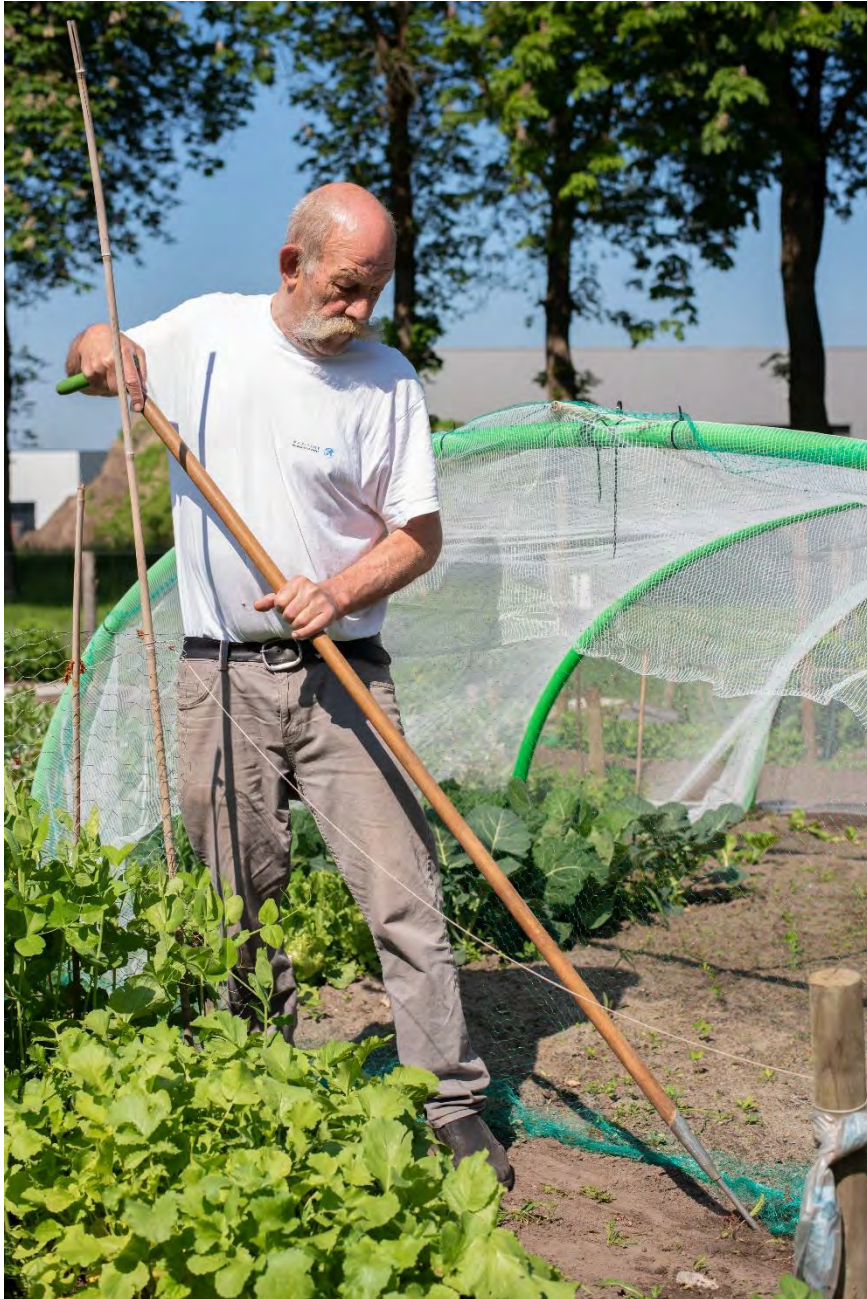
Volkstuinen De Vossenberg, Kaatsheuvel