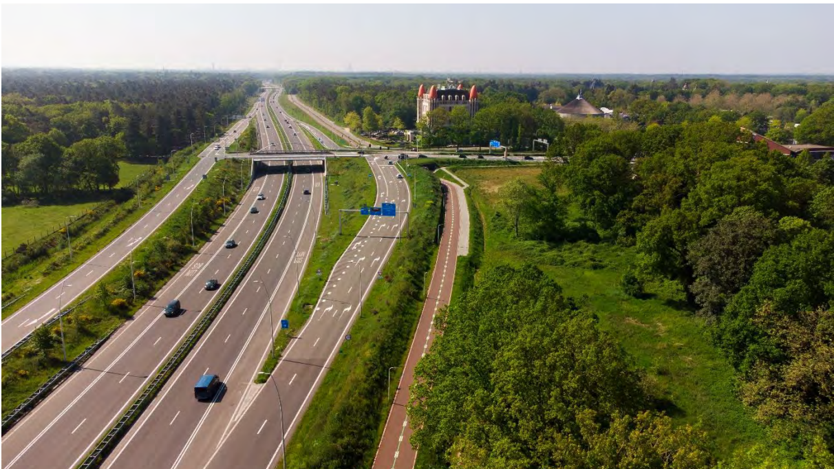
N261 en snelfietsroute F261, ontsluiting naar de Efteling

Pro3 heeft extra oog voor de verkeersveiligheid van, naar en rondom de scholen in de kernen. We zorgen ervoor dat alle scholen goed en veilig bereikbaar zijn.