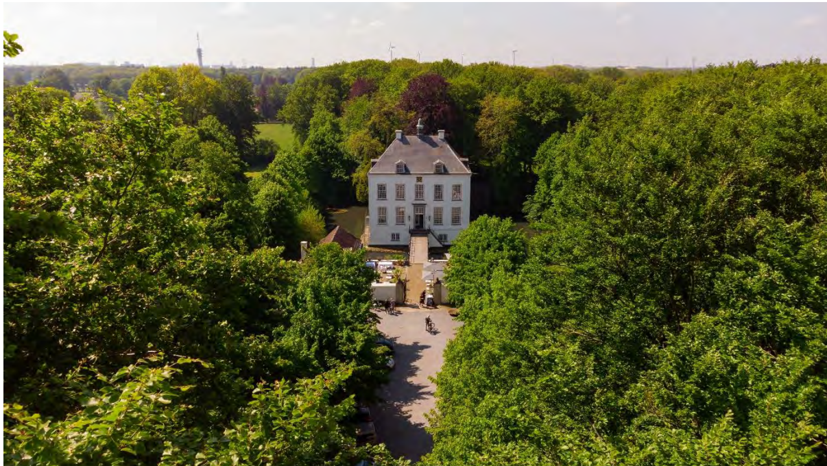
Witte Kasteel, kerkdorp Loon op Zand

Onze winkelgebieden zijn compact en aantrekkelijk ingericht met voldoende horecavoorzieningen. Er is een divers winkelaanbod voor een breed publiek. Verloedering en leegstand gaan we actief tegen. De gemeente moet onze winkeliers ondersteunen door lokaal kopen te stimuleren.