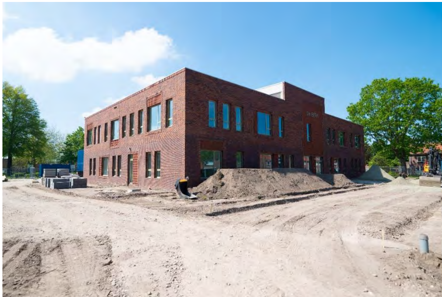
Basisschool De Berk (in aanbouw), Kaatsheuvel

Een onafhankelijke bezwaren- en klachtencommissie is essentieel voor een goede dienstverlening. Hiermee hebben inwoners de mogelijkheid om besluiten van de gemeente te laten toetsen door een onafhankelijke derde.