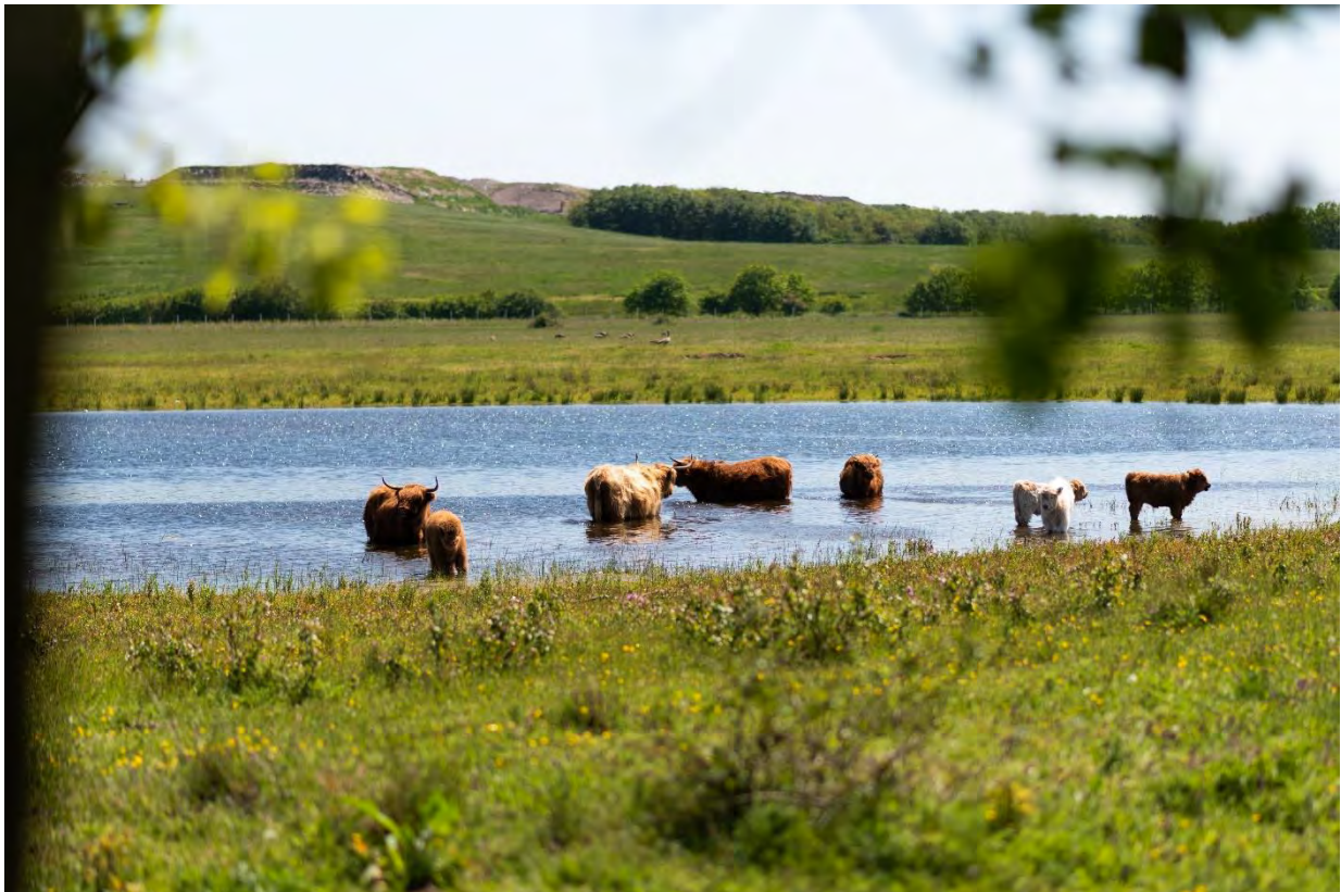
Schotse Hooglanders, Huis ter Heide, De Moer

Onder deze voorwaarden is zelfstandigheid van onze gemeente logisch voor Pro3.