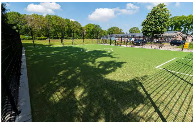
Voetbalkooi Klakkenlaan, Loon op Zand

Schulden hebben en leven in armoede heeft een enorme invloed op welzijn, vertrouwen in de toekomst en het gevoel dat je er mag zijn en dat je ertoe doet. Schulden moeten we zo vroeg mogelijk aanpakken. Hier ligt een sleutelrol voor de gemeente. Door vroegtijdige signalering van schulden en directe ondersteuning wordt erger voorkomen. Goede schuldhelpverlening en een ruimhartig minimum- en armoedebeleid zorgen ervoor dat inwoners weer volop mee kunnen doen. De gevolgen van schulden en armoede op kinderen moeten meer aandacht krijgen.