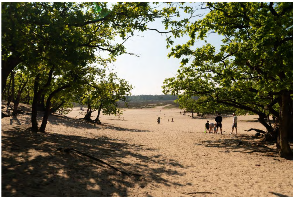
Loonse en Drunense Duinen

Met heldere, duidelijke en zichtbare communicatie moet de gemeente inzetten op een betere afvalscheiding. Hierbij zetten we ook het Inwonerspanel en afvalcoaches in de wijken in. De gemeente stimuleert hergebruik van materialen, kleding en apparaten.