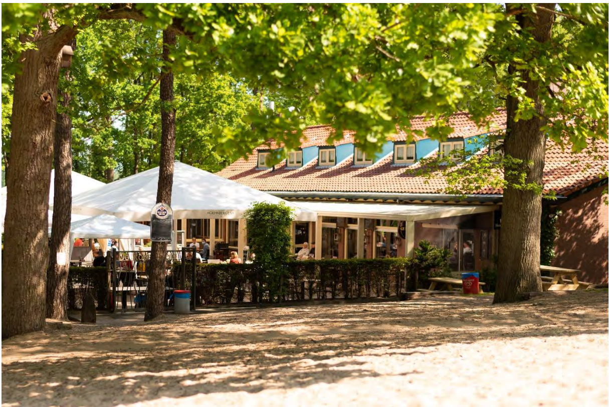
De Roestelberg, Loonse en Drunense Duinen